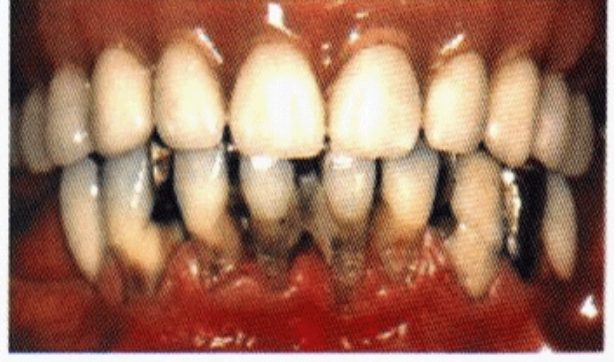
مريض يعاني من مرض السكر , التهابات لتويبه حادة في الفك السفلي, وطقم أسنان كامل في الفك العلوي نتيجة لفقدان الأسنان

3.الوراثة تؤثر على بنية الجسم وقوة مناعته. 4.الحالة النفسية.