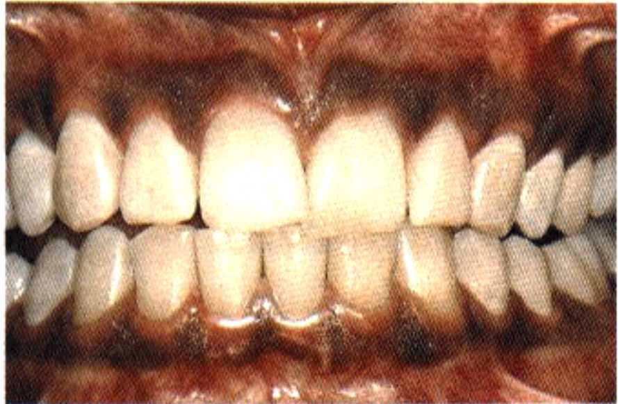
اللثة الصحية لدى الانسان ذات البشرة السوداء تتمتع بلون بني