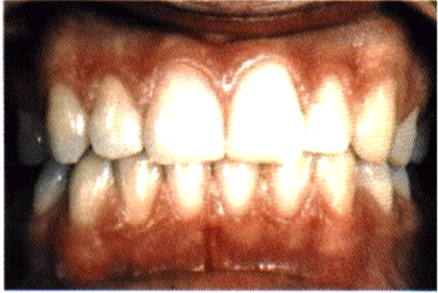
اللثة الصحية ذات اللون الوردي ( الانسان الأبيض ) المتحمة مع الأسنان في منطقة عنق الأسنان, وخالية من الاحمرار أو التضخم

الثابتة. إن أنسجة اللثة الصحية الغير مصابة بالأمراض والالتهابات تتمتع بلون وردي لدى الإنسان ذات البشرة البيضاء وبلون بني لدى الإنسان ذات البشرة السوداء ، وتكون خالية من الإحمرار أو التضخم محكمة الإتصال مع الأسنان وغير قابلة للتحريك .